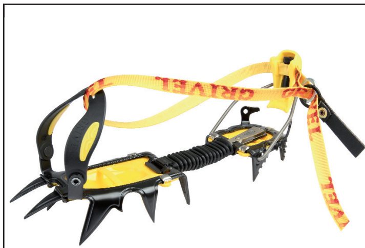
G12 new matic art. RA074A02